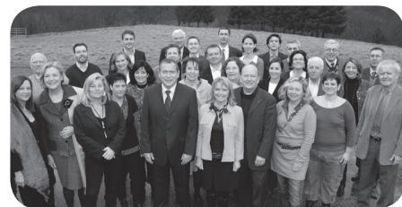
les 33 membres de la liste Ecully en mouvement 2008

Si cette négociation a eu lieu, alors faites vite connaître aux éculloises et écullois toute la vérité : qui avez-vous rencontré, quel jour, quels étaient les termes de vos accords ? La question est simple : soit il y a eu négociation entre vous et monsieur Uhrlich entre les deux tours pour battre Régis Blanc, soit il n'y a pas eu négociation.